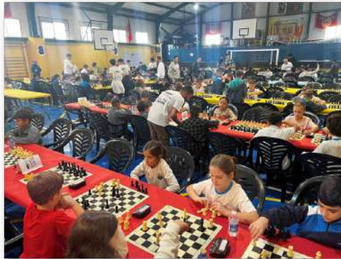
OPEN CHES INTERCENTROS