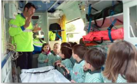
Servicios de emergencias